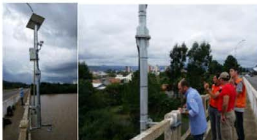
「総務省：ネット技術による社会課題解決の調査研究」によりブラジルに設置した水位監視局