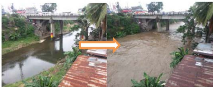
急激に増水するフィリピンの川。 JICA 草の根技術協力で当社が設置した洪水監視カメラの画像

当社は2004年に、新潟県と福島県で発生した7.13水害を経験。それを契機として2005年に同SCOPE事業で「インテリジェントビデオセンサー（水位監視）」を長岡技大と共同で開発しました。2009年には長岡市の防災情報システムを開発・構築。さらに2013年にJICAの海外事業案件を受託し、バングラディッシュ、フィリピンへ水害対策の調査、当社で開発したスマートフォンによる監視カメラと水位計の設置を行いました。また今回のSCOPE事業への挑戦と同時に、国土交通省の「革新的河川管理プロジェクト（第1弾）」に参画し、河川管理及び災害対応の高度化を図る研究開発を日本無線（株）様、日本電波工業様と共同で行っています。